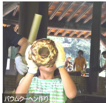
バウムクーヘン作り