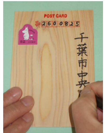
『思い出の板ハガキ作り』

里山の自然が展示された資料室。 気になったことは、ここで調べてみ よう。展示室内の謎を解く「展示室 ビンゴ」もオススメ。