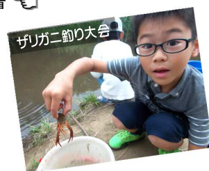
ザリガニ釣り大会

自然の家の旬な情報満載のメールマガジン会員を募集中！詳しくはホームページをご覧ください。