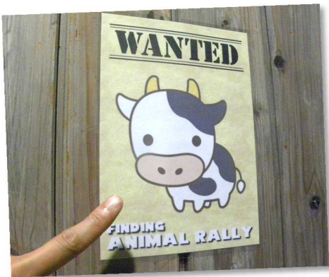
『ファインディング アニマルラリー』

ハイキングに行くほどの時間はないけれど、ちょっとだけ時間が空いてしまった。何をしよう・・・と迷った時におすすめのお手軽プログラムを紹介します。全部できたら自然の家マスターになれるかも！？