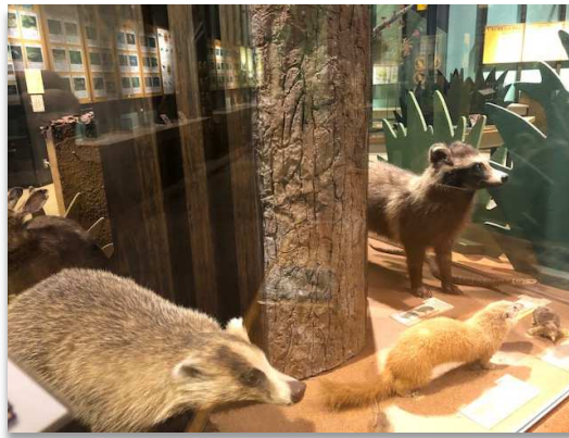
『環境学習センター1F 展示室』

里山の自然が展示された資料室。 気になったことは、ここで調べてみ よう。展示室内の謎を解く「展示室 ビンゴ」もオススメ。