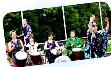
【ステージコーナー】