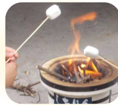
【体験プログラムコーナー】