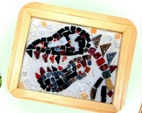
【クラフトコーナー】