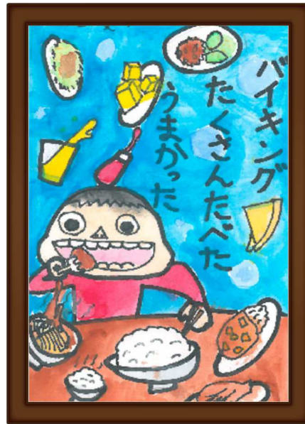
千葉市少年自然の家所長賞