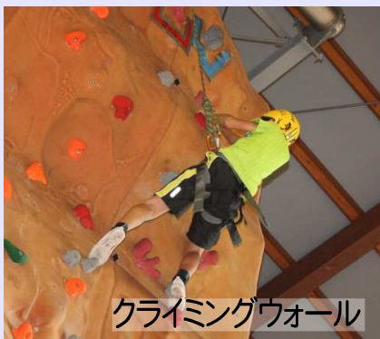
クライミングウォール